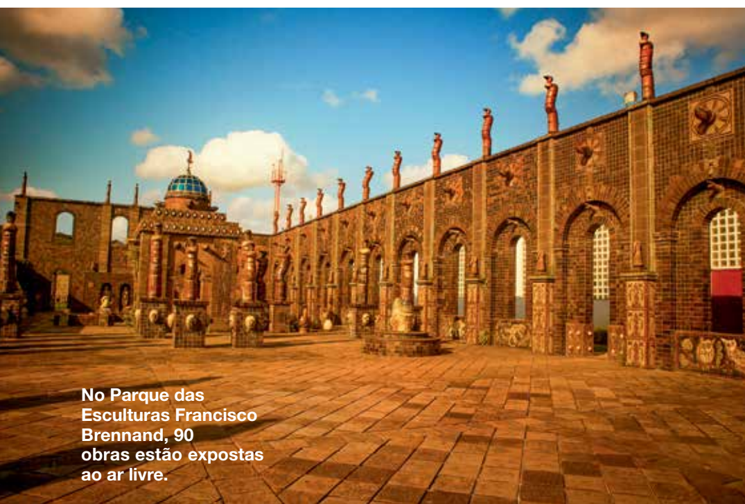
No Parque das Esculturas Francisco Brennand, 90 obras estão expostas ao ar livre.