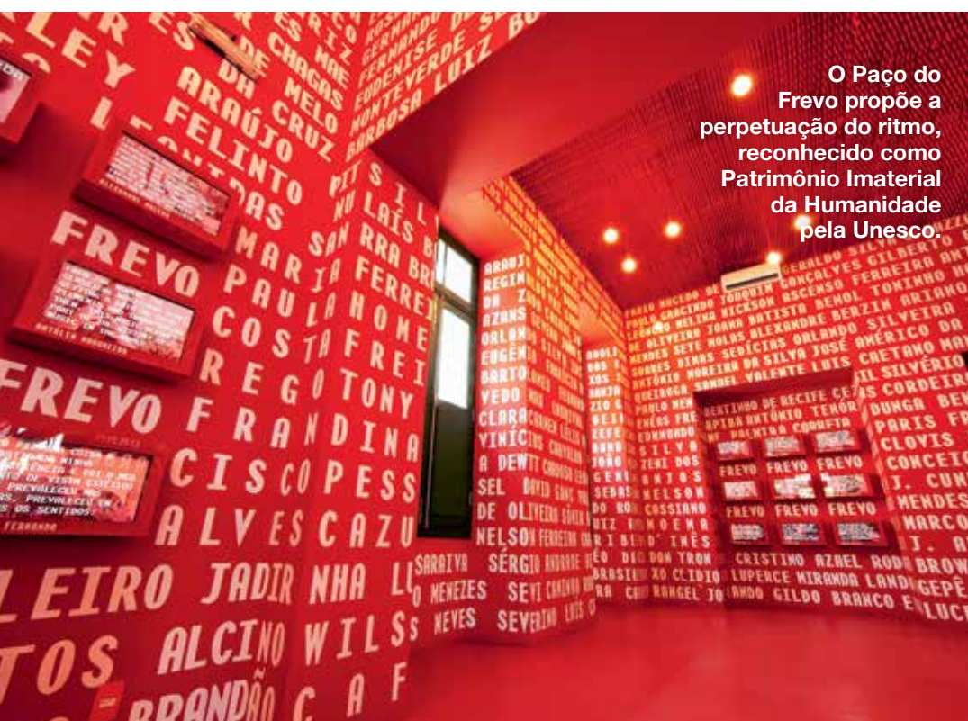
O Paço do Frevo propõe a perpetuação do ritmo, reconhecido como Patrimônio Imaterial da Humanidade pela Unesco.