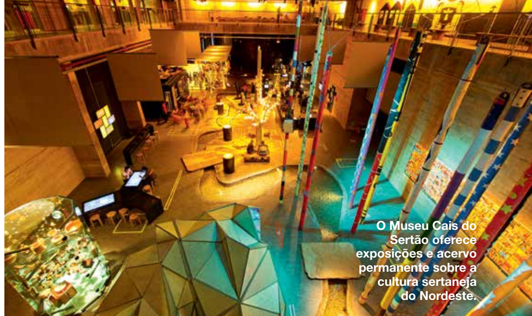
O Museu Cais do Sertão oferece exposições e acervo permanente sobre a cultura sertaneja do Nordeste.

São 482 anos de história, arte, cultura, gastronomia e atrativos que a capital pernambucana pode oferecer ao turista, que é muito bem vindo para conhecer “Esse é o Meu Recife”, campanha desenvolvida pela Secretaria de Turismo, Esporte e Lazer. “Existem cidades singulares, que enchem os olhos de quem conhece e transforma viajantes experientes em marinheiros de primeira viagem, deslumbrados com cores, cheiros, sabores, sons e sensações. Essa